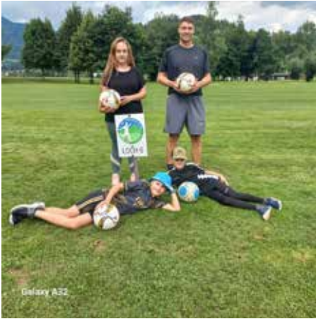
Golfclub Dilly - Footgolf