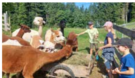
Alpakahof Seeschuster Alles rund um's Alpaka