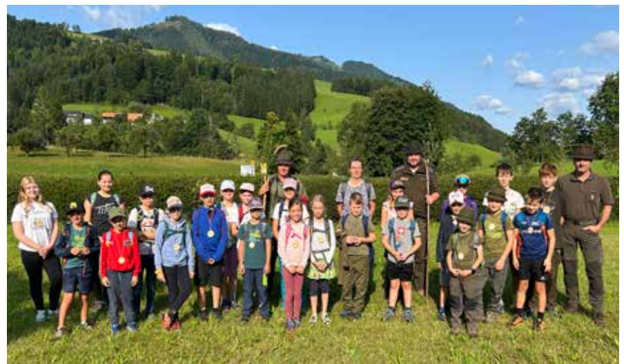
ÖVP-Roßleithen - Rund um Wild und Wald