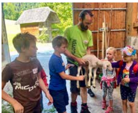
ÖVP Roßleithen Sommerspaß am Bauernhof