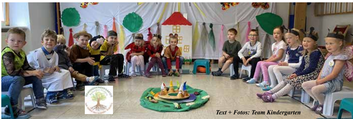
Text + Fotos: Team Kindergarten

Es war ein Fest der Generationen, dass hoffentlich allen noch lange in liebevoller Erinnerung bleiben wird!