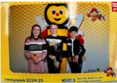
Text & Fotos: Lena Herndl

Die Kinder der 4. Klasse durften zur Leseolympiade fahren und belegten den tollen 2. Platz.