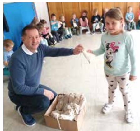
Bericht und Fotos: AK Leiter Bgm. Kurt Pawluk

onen über die wertvollen Inhaltsstoffe des Apfels sowie einige kreative Rezepte, um die gesunde Frucht vielseitig zu genießen.