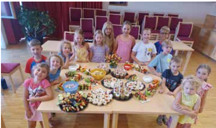
Kalte Köstlichkeiten - SPÖ-Frauen Roßleithen