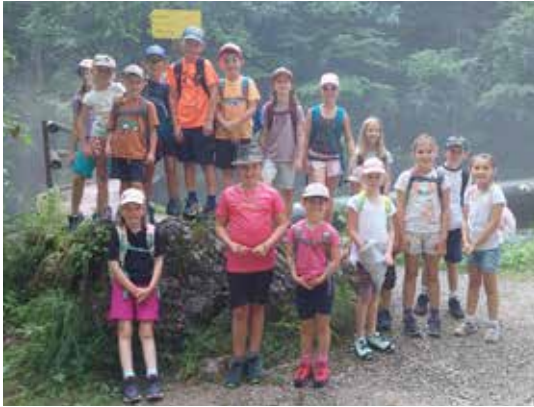
Der Waldschatz am Gleinkersee - EV Roßleithen