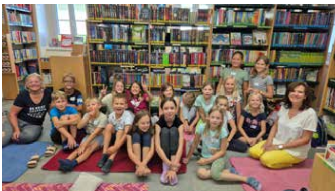
Verspielt durch die Ferien - Bibliothek Windischgarsten