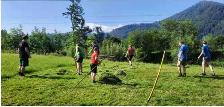
Sensenmähen - Kinderfreunde Roßleithen