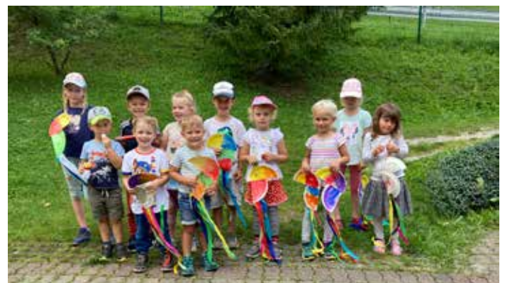
Kunterbunter Vormittag - EV-Roßleithen