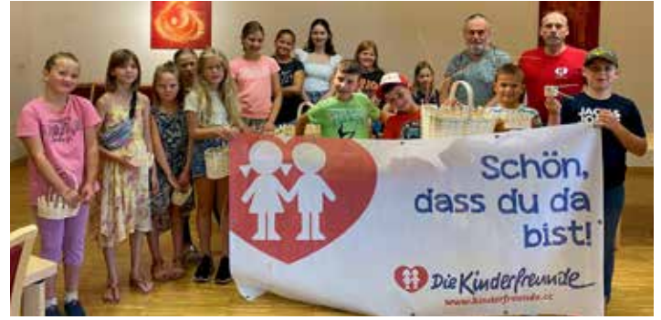
Kinderkorbflechten - Kinderfreunde Roßleithen