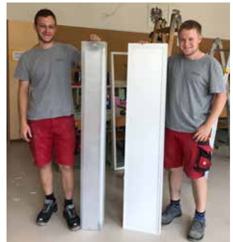
Umgesetzt wurde Beleuchtungstausch von der Fa. ETECH Schmid u. Pachler Elektronik GmbH & Co KG Windischgasteln!

Mit dem Umstieg auf LED-Beleuchtung setzt die Volksschule Roßleithen ein Zeichen für eine nachhaltige Zukunft und zeigt, wie moderne Technik gezielt zum Wohl von Schülern und Umwelt eingesetzt werden kann.