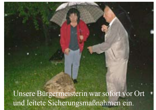
Unsere Bürgermeisterin war sofort vor Ort und leitete Sicherungsmaßnahmen ein.

Bei einem starken Gewitter löste sich ein Stein oberhalb des Anwesens Humpf und blieb nach Überqueren der Straße am Straßenrand liegen. Nicht auszudenken, wenn sich dort jemand aufgehalten hätte. Wir werden deshalb auch diese Lücke noch schließen und den Weiterbau der Steinschlagsicherung in diesem Bereich forcieren.