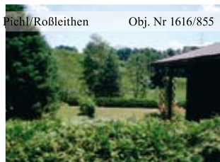
Pichl/Roßleithen Obj. Nr 1616/855 Sonniges Baugrundstück im Teichtal mit Gartenhütte und liebevoll angelegtem Garten. Gfl. ca. 840 m 2 . Baugrund zu verkaufen!