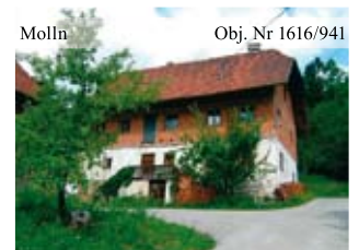
Molln Obj. Nr 1616/941 Renovierungsbedürftiger Bauernhof in absoluter Alleinlage mit ca. 11,5 ha Grund, asphaltierte Zufahrt endet beim Hof. Bauernhof zu verkaufen!

Mehr Informationen finden Sie unter: www.remax.at