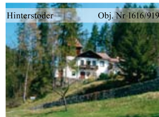
Hinterstoder Obj. Nr 1616/919 Charmante Landhausvilla in sonniger Lage, prachtvoller Ausblick, Wfl. ca. 100 m 2 , Gfl. ca. 4.212 m 2 , davon ca. 3.800 m 2 Wald Landhausvilla zu verkaufen!