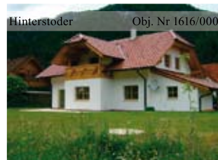
Hinterstoder Obj. Nr 1616/000 Neu, großzügig geplant, Erstbezug, sonnig, ruhig, Panoramablick, ca. 180 m 2 Wfl., ca. 785 m 2 Gfl., all das bietet dieses Wohnhaus. Wohnhaus zu verkaufen!