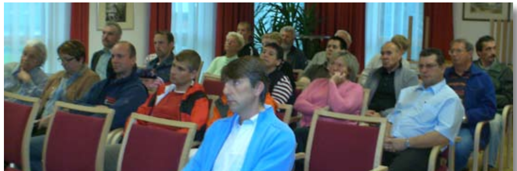
Bürgerversammlung am 24. Juni 2009

Bei einer Bürgerversammlung wurden alle betroffenen Bürgerinnen und Bürger eingeladen, sich ein Bild über die zu entstehende Heizanlage zu machen. Das Interesse war sehr groß. Mit den Bauarbeiten wurde bereits begonnen und die Fertigstellung ist im Herbst geplant, sodass schon im kommenden Winter mit heimischer Energie geheizt werden kann.