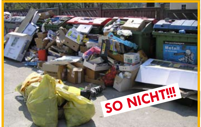
Sammelstelle Pichl, 14.04.2009